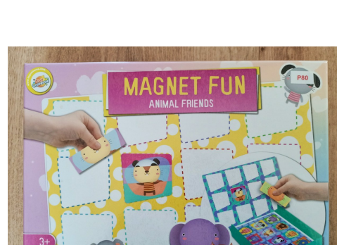
Magneet fun dieren P80