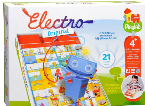
Electro original P86