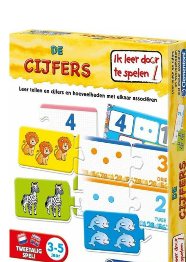
Ik leer door te spelen! De cijfers P83