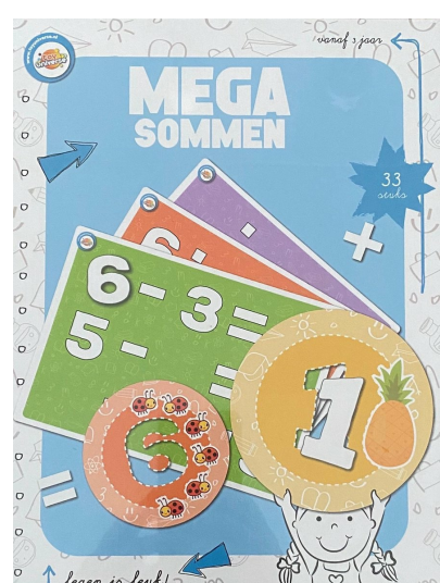
Mega sommen P82