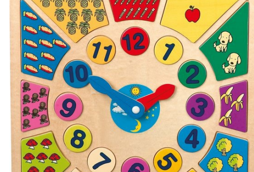
houten klok - leer klok kijken P87