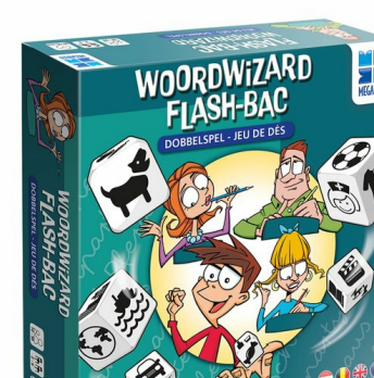
Woordwizard Flash-Bac G163