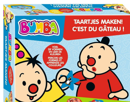
Bumba taartjes maken G164