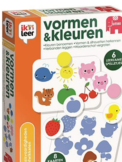
Ik leer vormen en kleuren P81